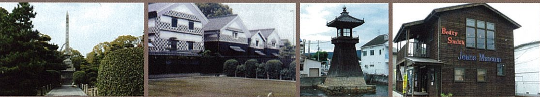
A 野崎家記念碑 B 旧野崎家住宅 C 野崎浜灯明台 D ベティ・スミスジーンズミュージアムアウトレット

児島商工会議所 ☎086-472-4450 倉敷観光コンベンションビューロー ☎086-421-0224 JR児島駅観光案内所 ☎086-472-1289